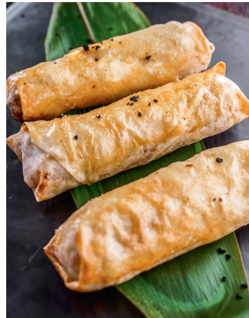
СПРИНГ РОЛЛ С КУРИЦЕЙ 60 60