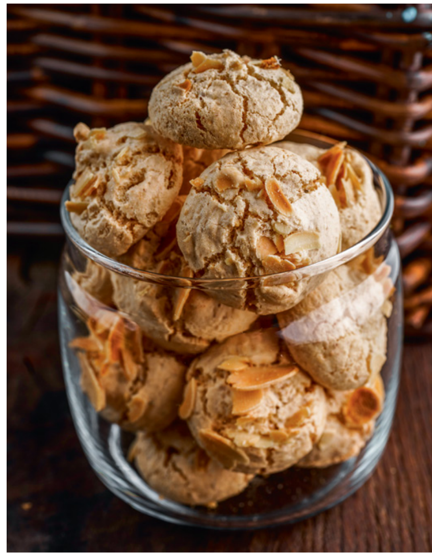
МИНДАЛЬНОЕ ПЕЧЕНЬЕ (БЕЗЕ)