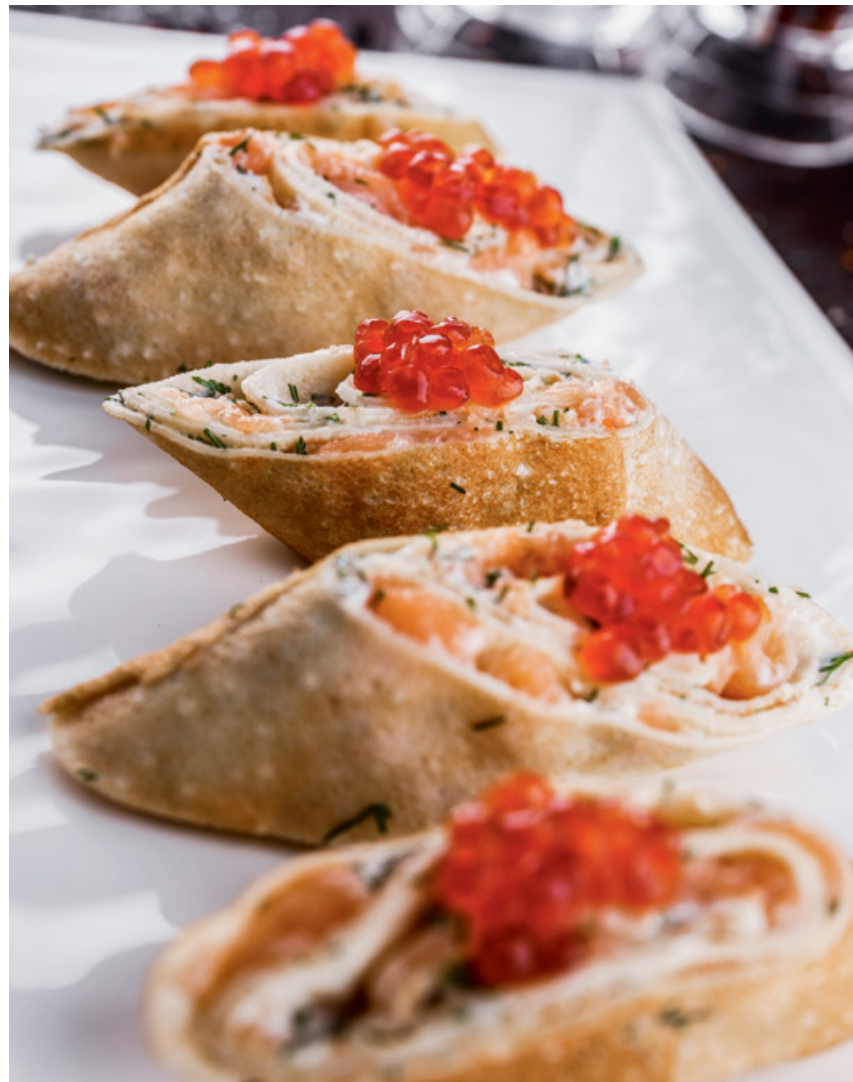
БЛИННЫЕ РУЛЕТКИ С СЕМГОЙ