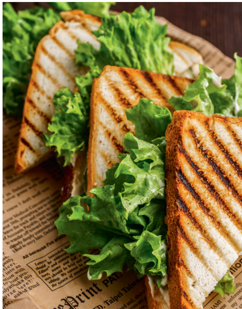
СЭНДВИЧ С КУРИЦЕЙ 175 125