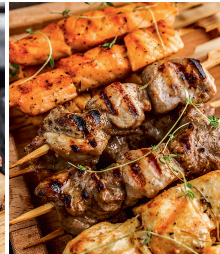
МИНИ-ШАШЛЫЧКИ - ИЗ КУРИЦЫ - ИЗ СВИНИНЫ - ИЗ СЁМГИ