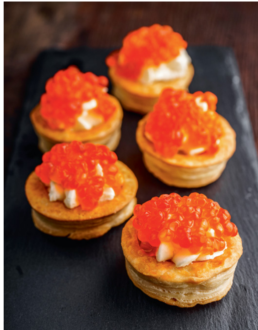
ВАЛОВАНЫ С КРАСНОЙ ИКРОЙ