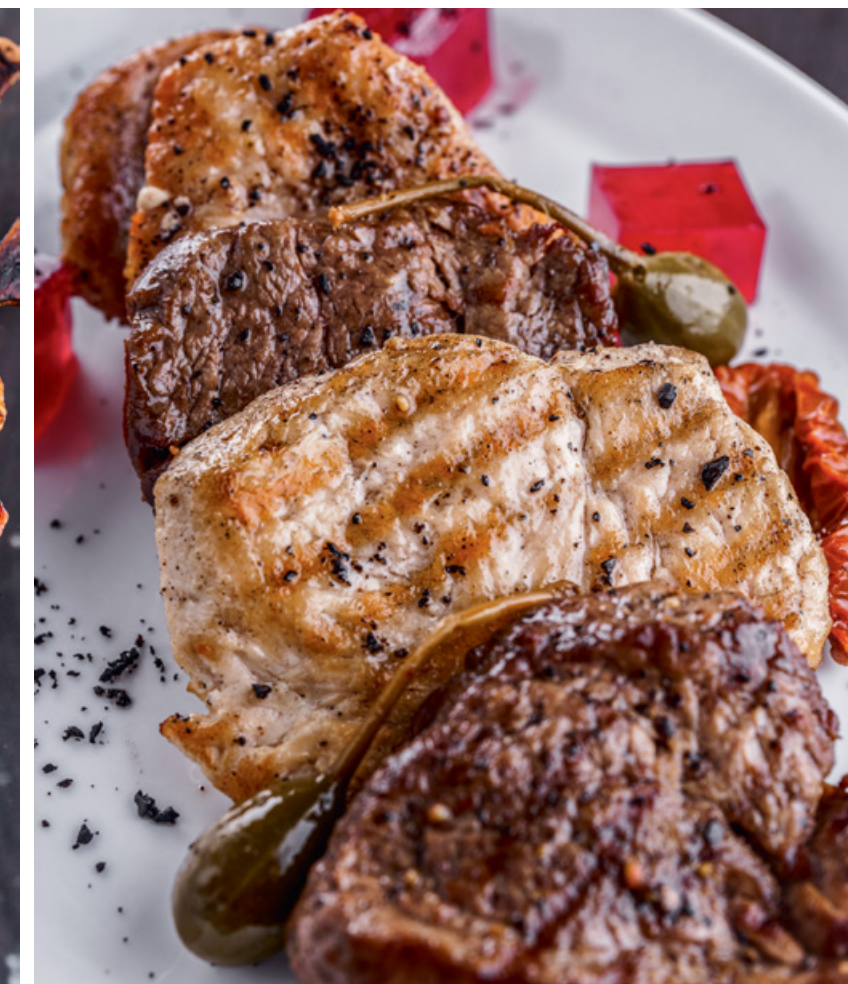
МЕДАЛЬОНЫ - ИЗ ГОВЯДИНЫ - ИЗ ИНДЕЙКИ