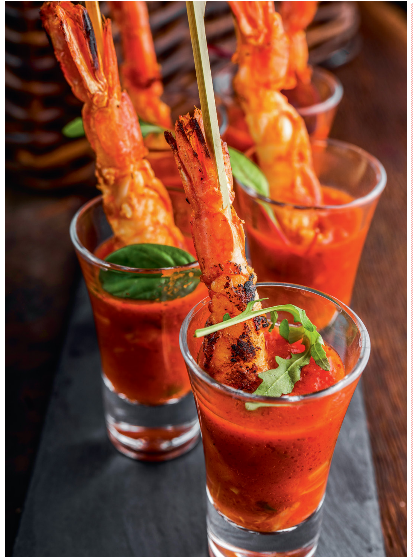
ШОТ ИЗ ДИКОГО ЛАНГУСТИНА С САЛЬСОЙ