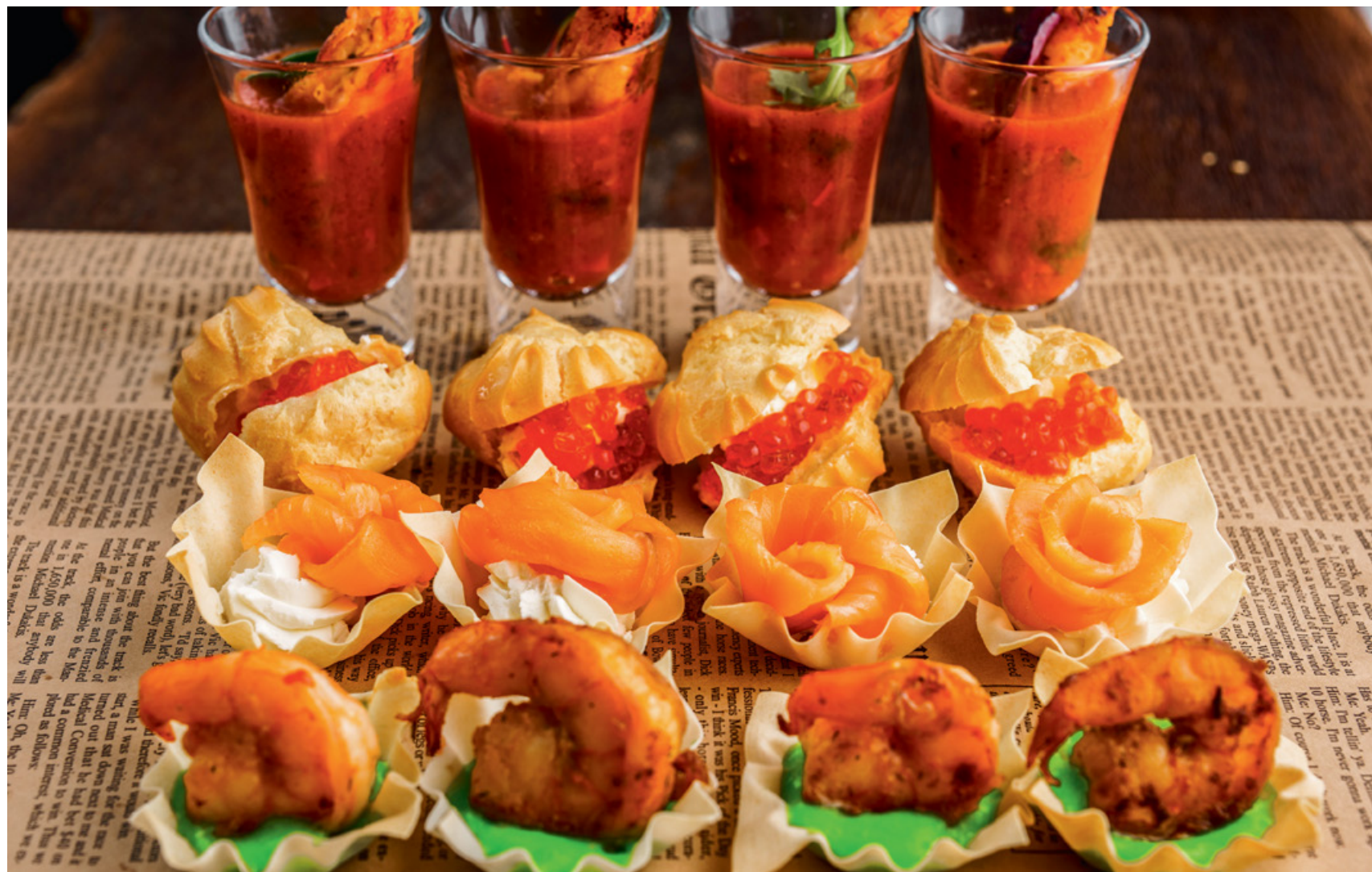
СЕТ МОРСКИХ КАНАПЕ