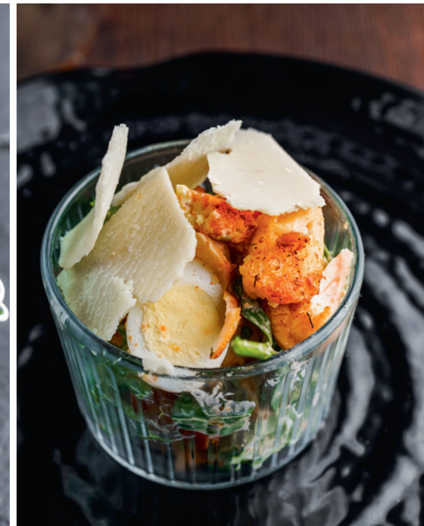
САЛАТ ЦЕЗАРЬ - С КУРИЦЕЙ - С СЕМГОЙ