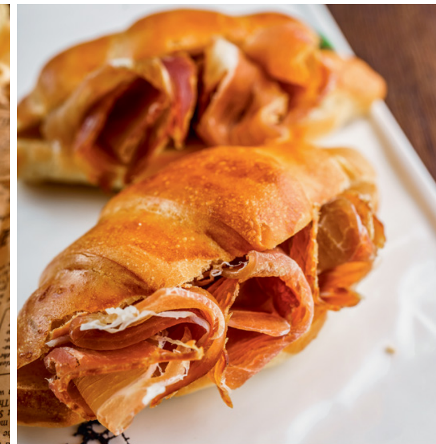
КРУАССАН С СЁМГОЙ