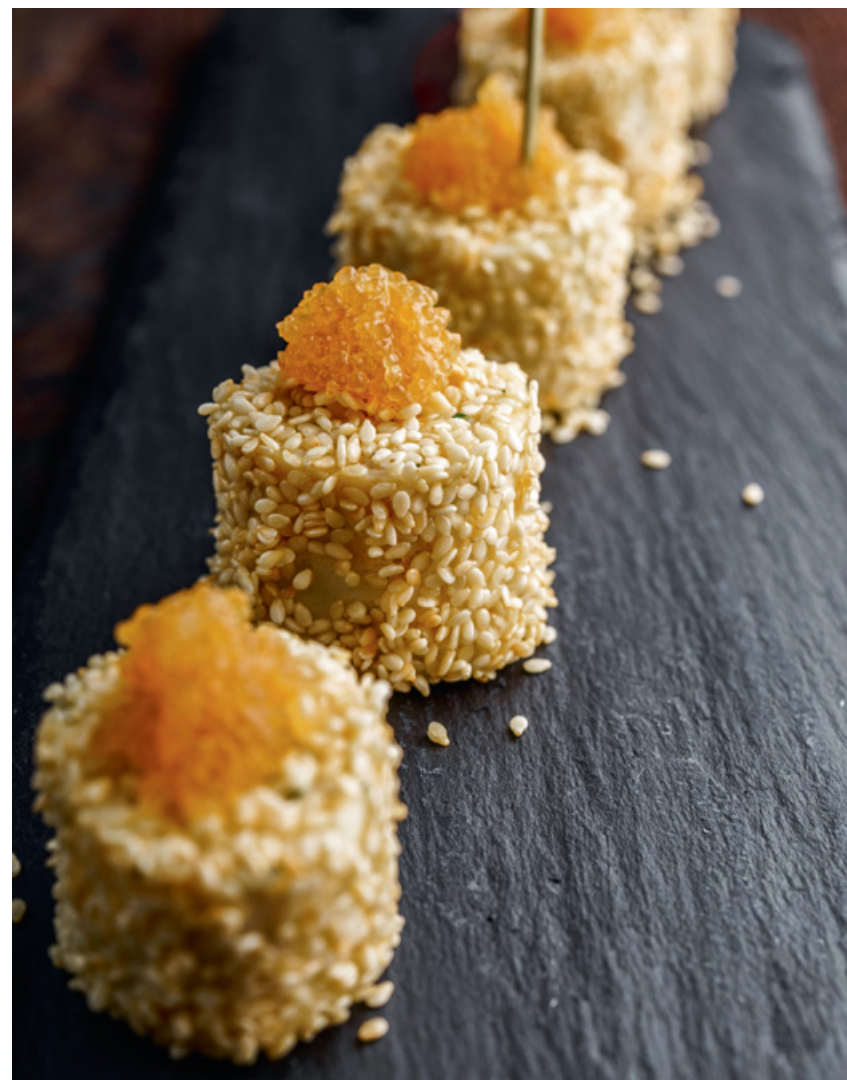
РОЛЛЫ БЛИННЫЕ С ЩУЧЬЕЙ ИКРОЙ 150 220