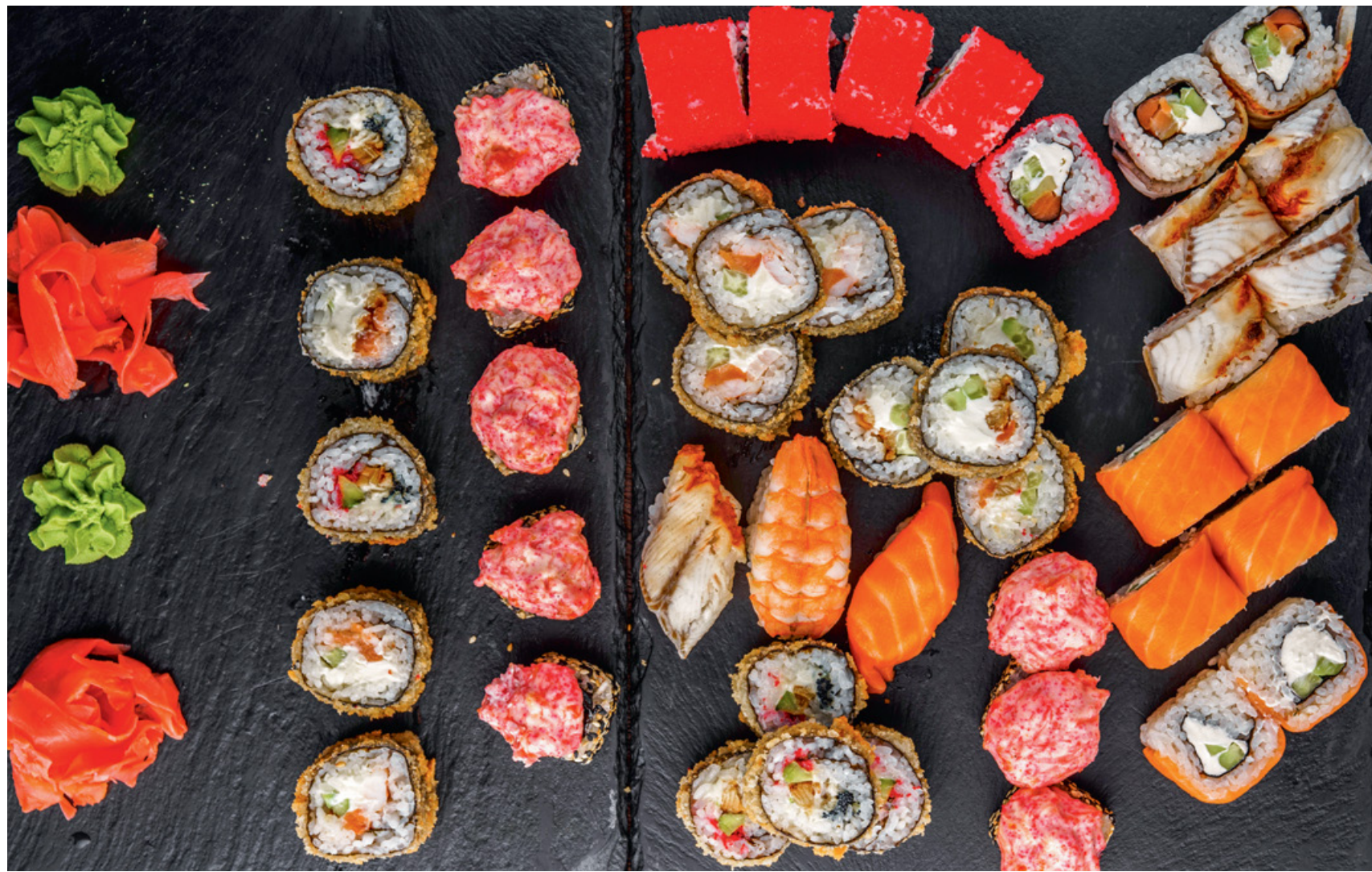
СЕТ ЯПОНСКИХ РОЛЛОВ