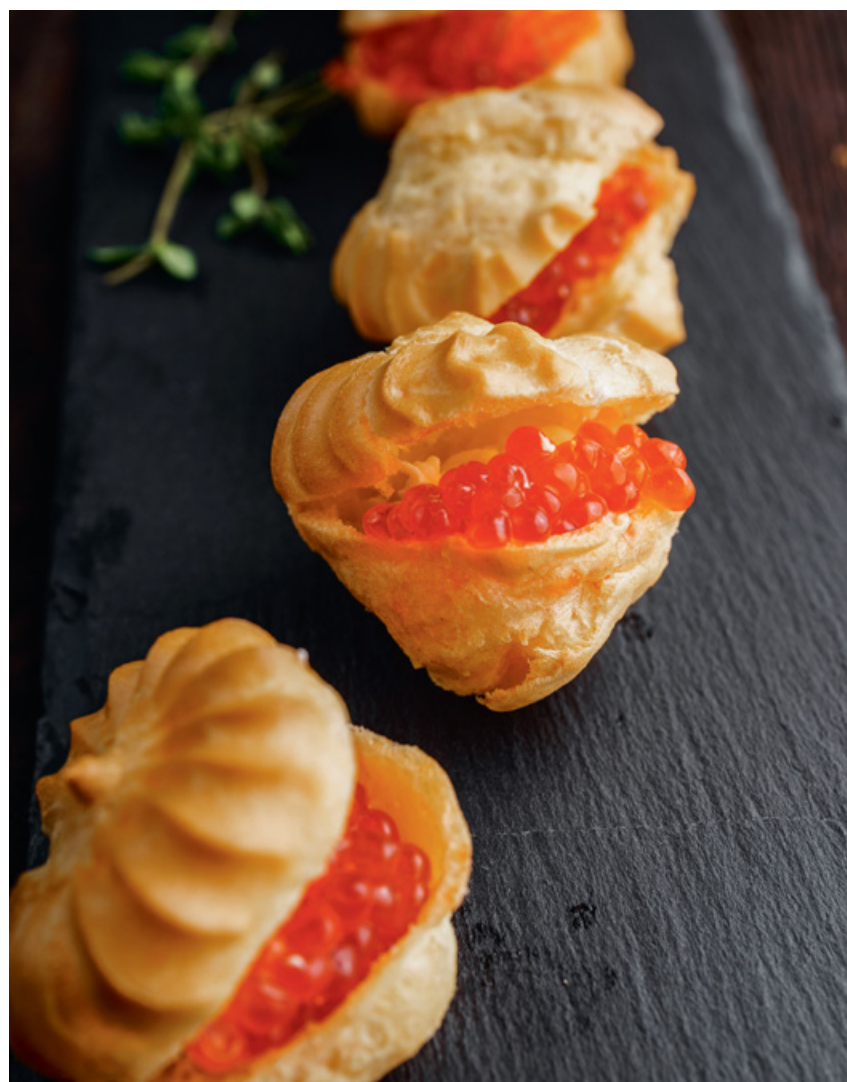
ПРОФИТРОЛИ С КРАСНОЙ ИКРОЙ 25 90