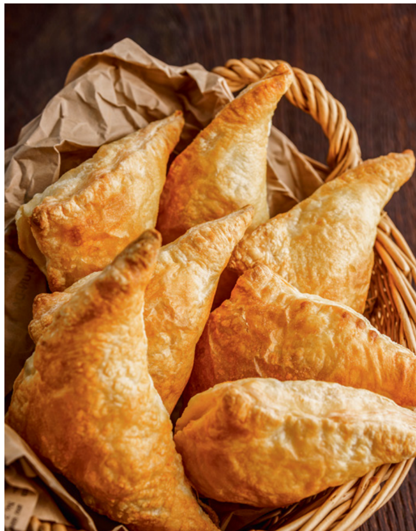
СЛОЕНЫЕ ХАЧАПУРИ С СЫРОМ