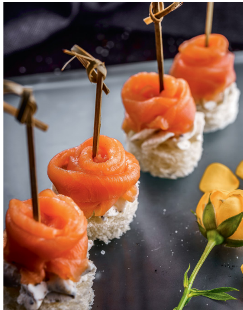
КАНАПЕ С СЕМГОЙ 35 85