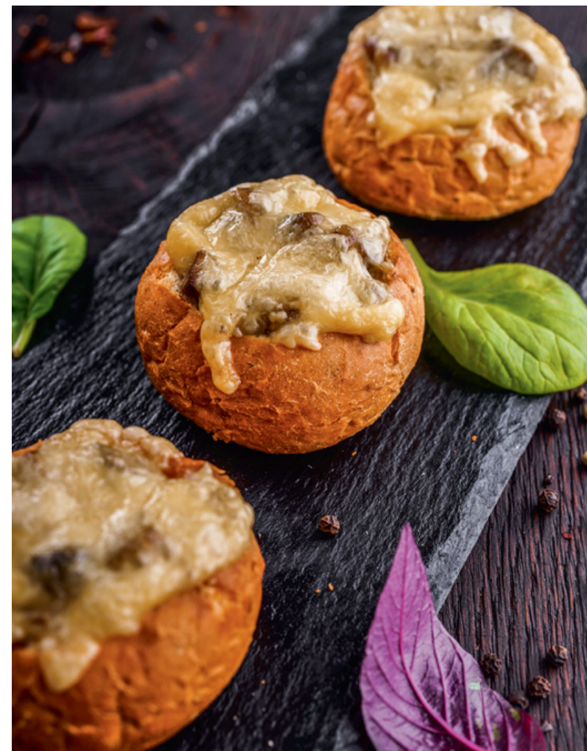
МИНИ-ЖЮЛЬЕН С КУРИЦЕЙ ИЛИ С ГРИБАМИ