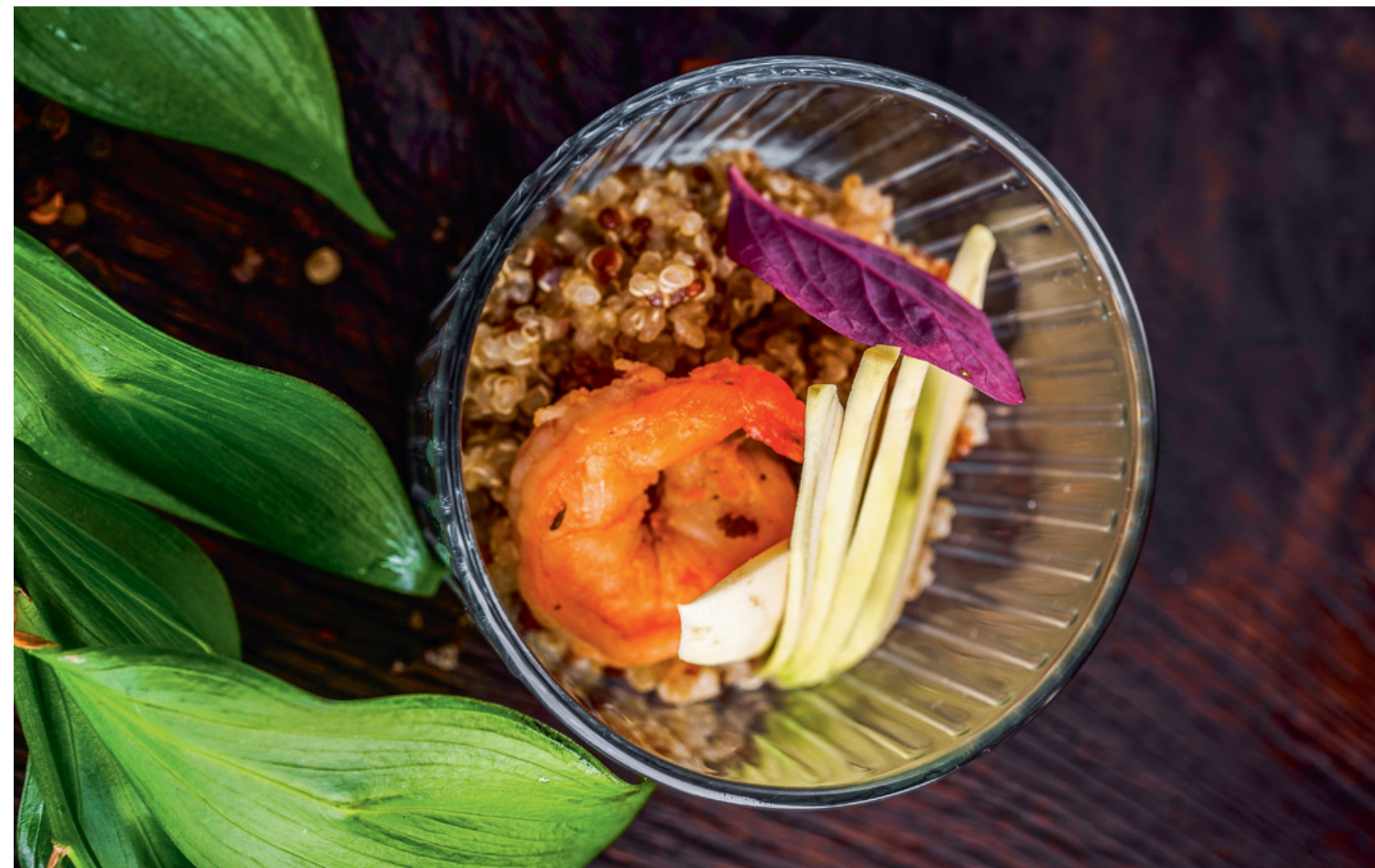
САЛАТ КИНОА С КРЕВЕТКОЙ И АВОКАДО