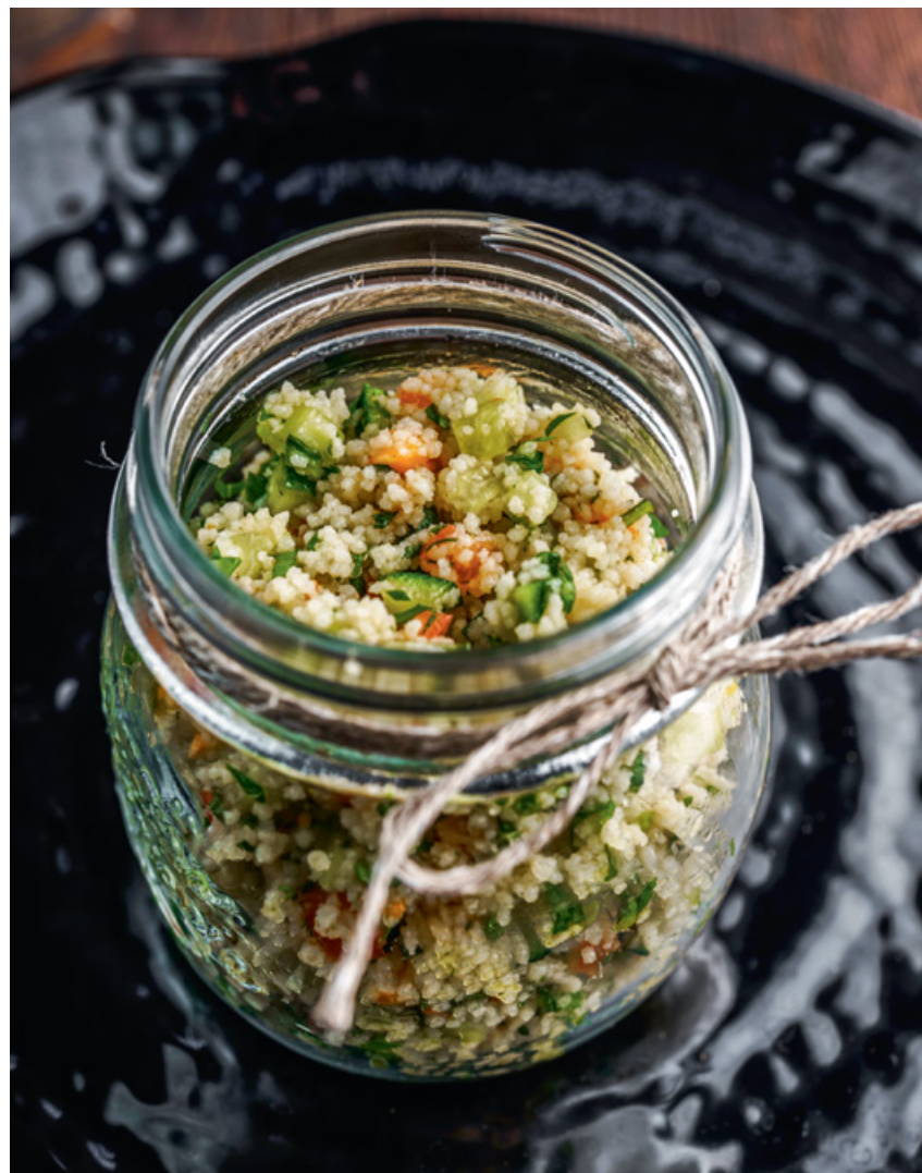
САЛАТ С КУС-КУСОМ