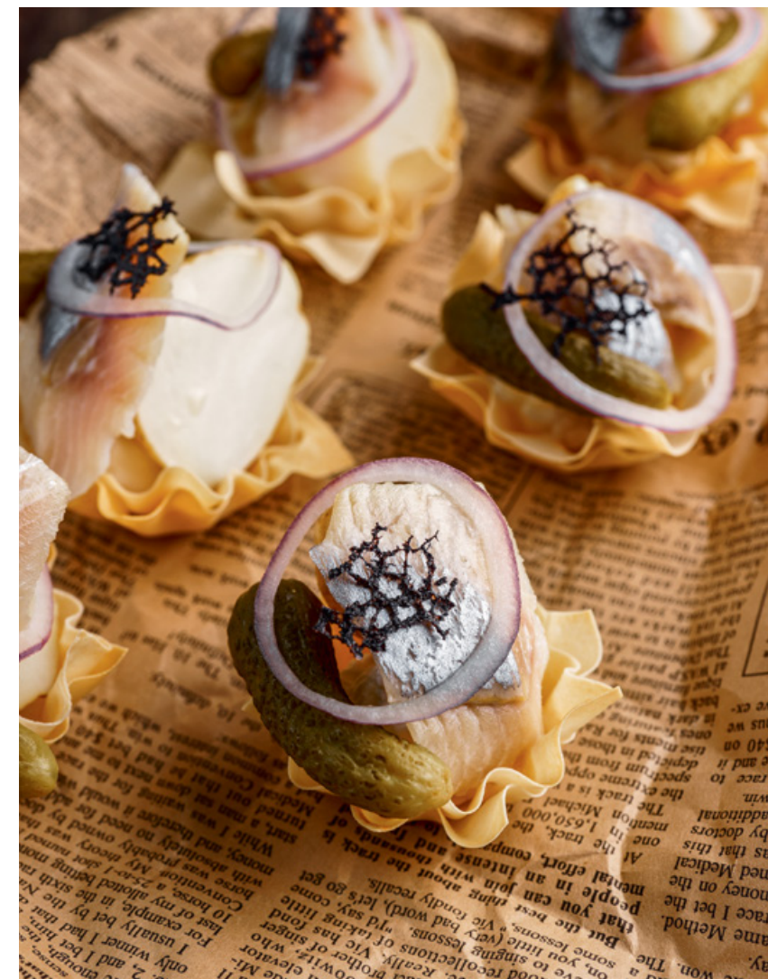
КОРЗИНОЧКА С СЕЛЬДЬЮ И КАРТОФЕЛЕМ