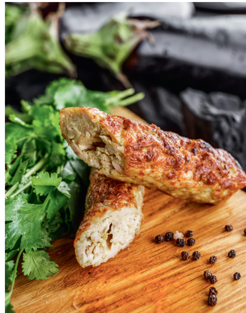
КЕБАБ ИЗ КУРИЦЫ