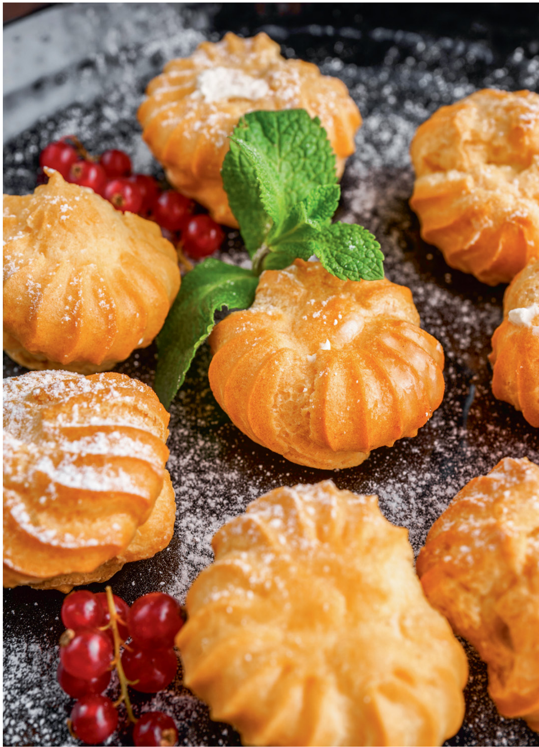
ПРОФИТРОЛИ С ЗАВАРНЫМ КРЕМОМ