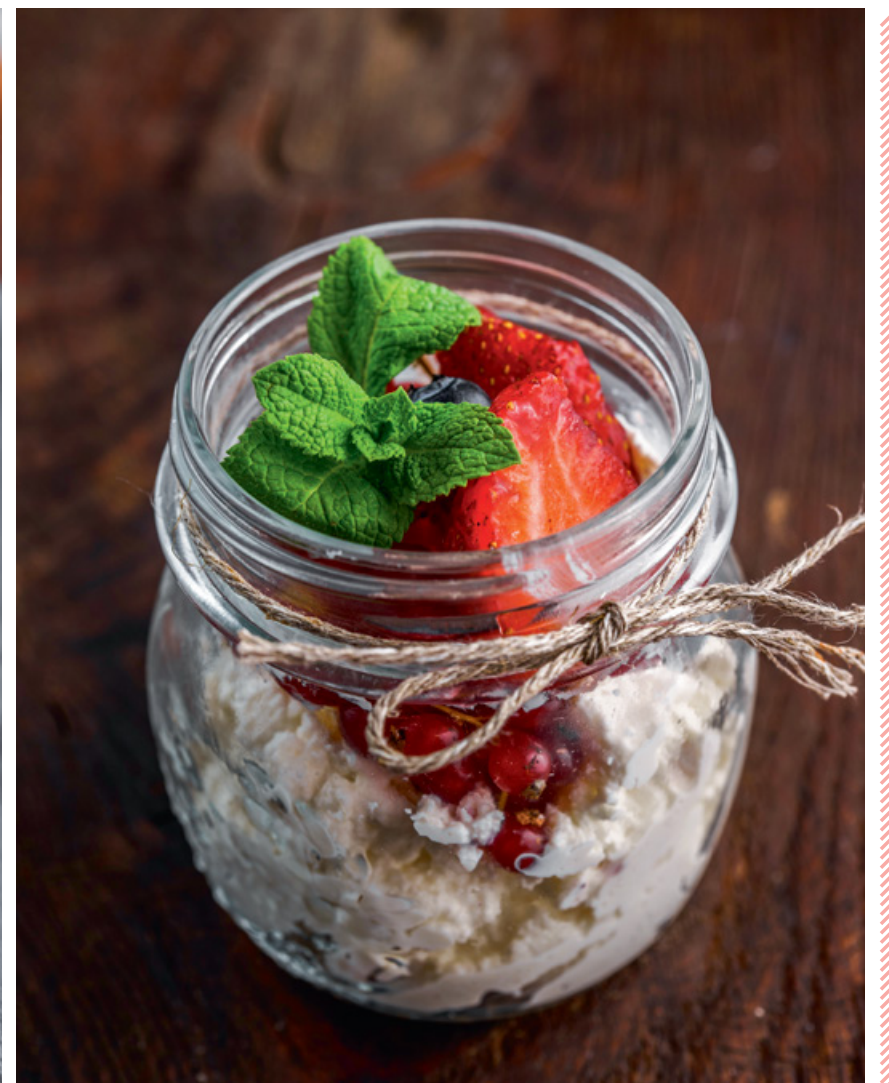
ДЕСЕРТ С ЯГОДАМИ И РИКОТТОЙ