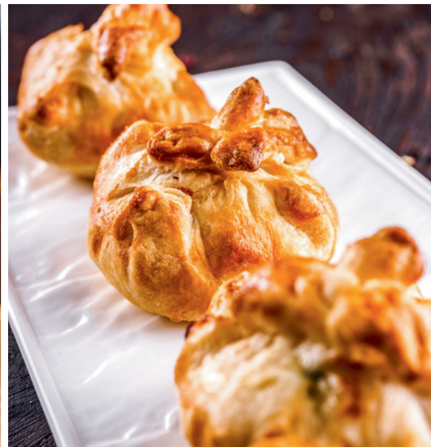
МЕШОЧКИ ИЗ СЛОЕНОГО ТЕСТА С СЕМГОЙ