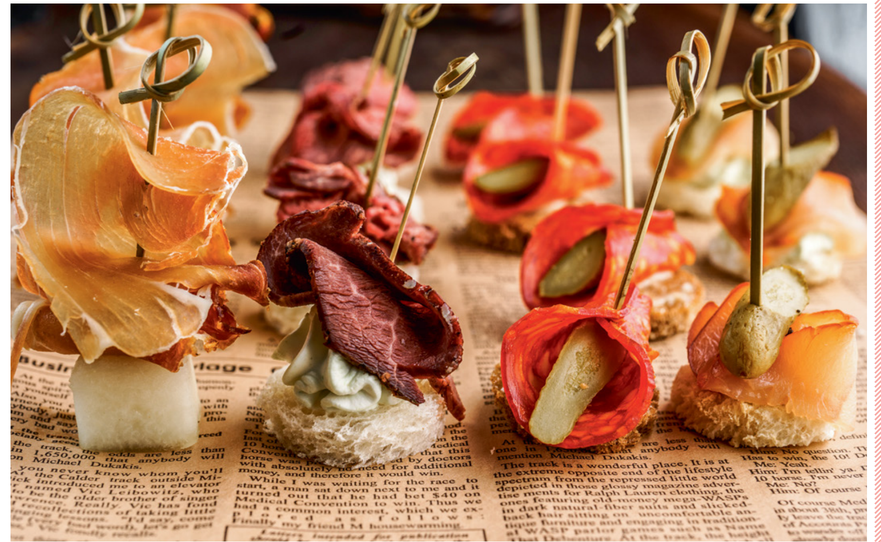
СЕТ МЯСНЫХ КАНАПЕ