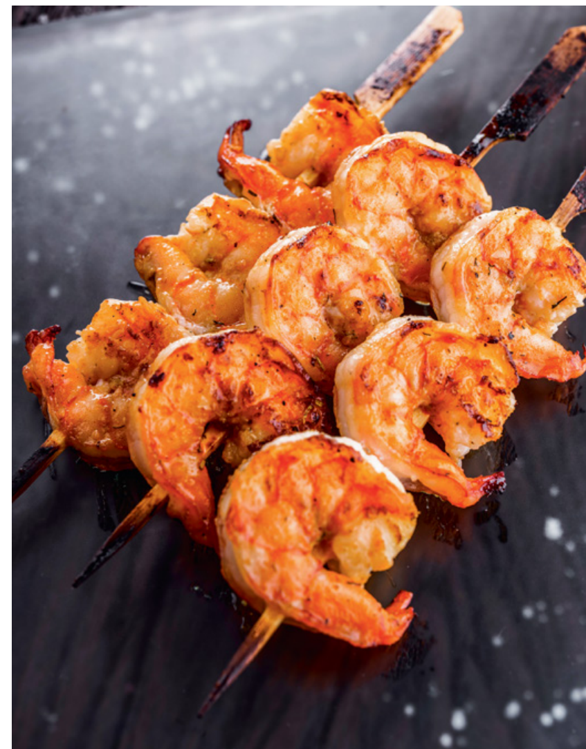
МИНИ-ШАШЛЫЧКИ ИЗ КРЕВЕТОК