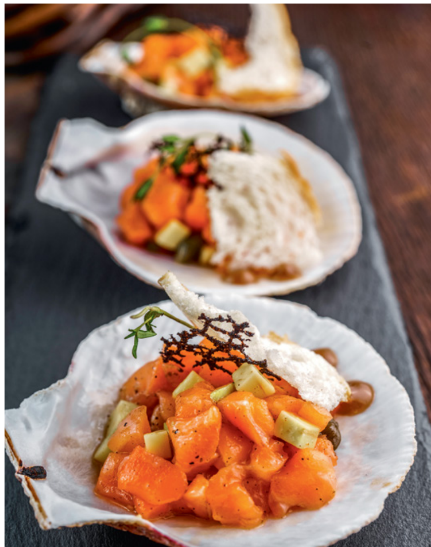
ТАР-ТАР ИЗ ЛОСОСЯ