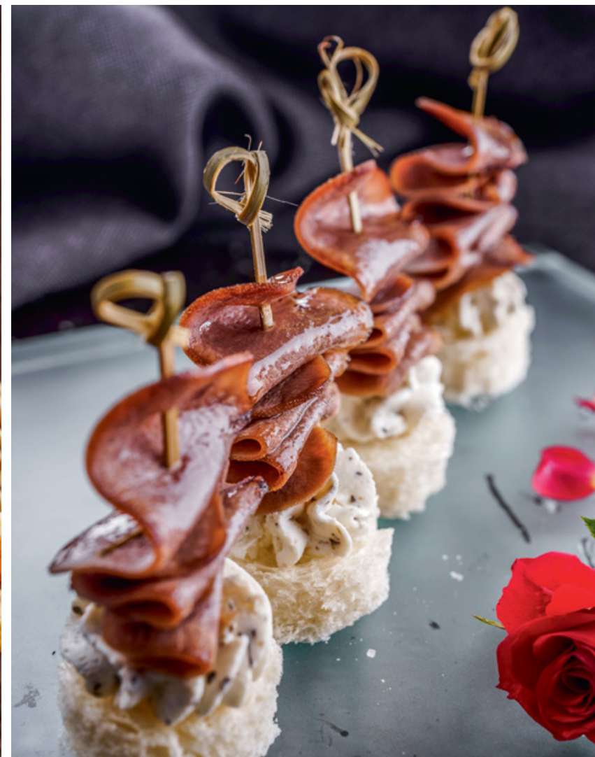
КАНАПЕ С ЯЗЫКОМ