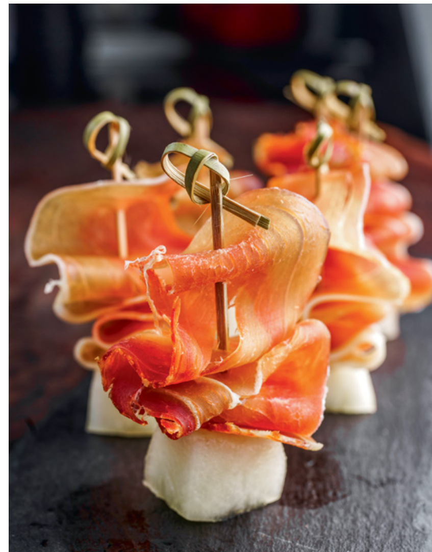
КАНАПЕ С ДЫНЕЙ И ПРОШУТО