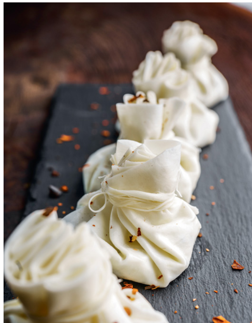
МЕШОЧКИ НАДУГИ 35 80