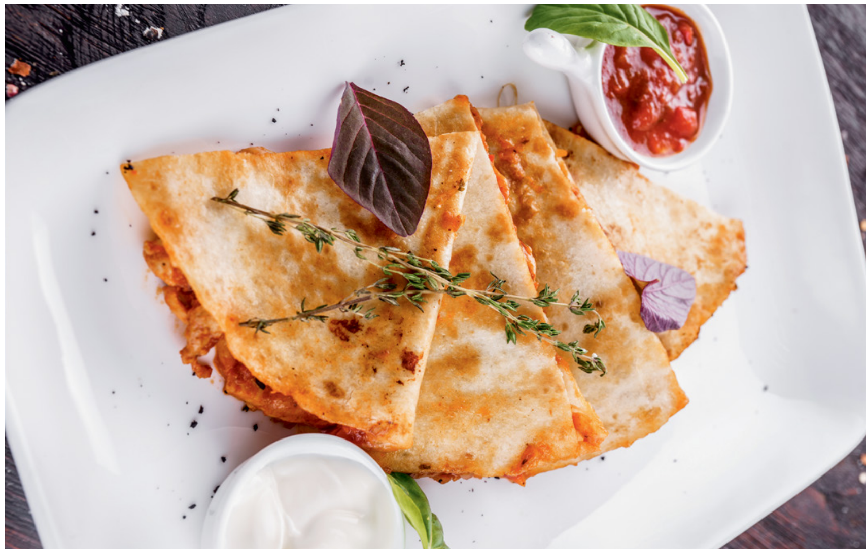
КЕСАДИЛЬЯ С КУРИЦЕЙ