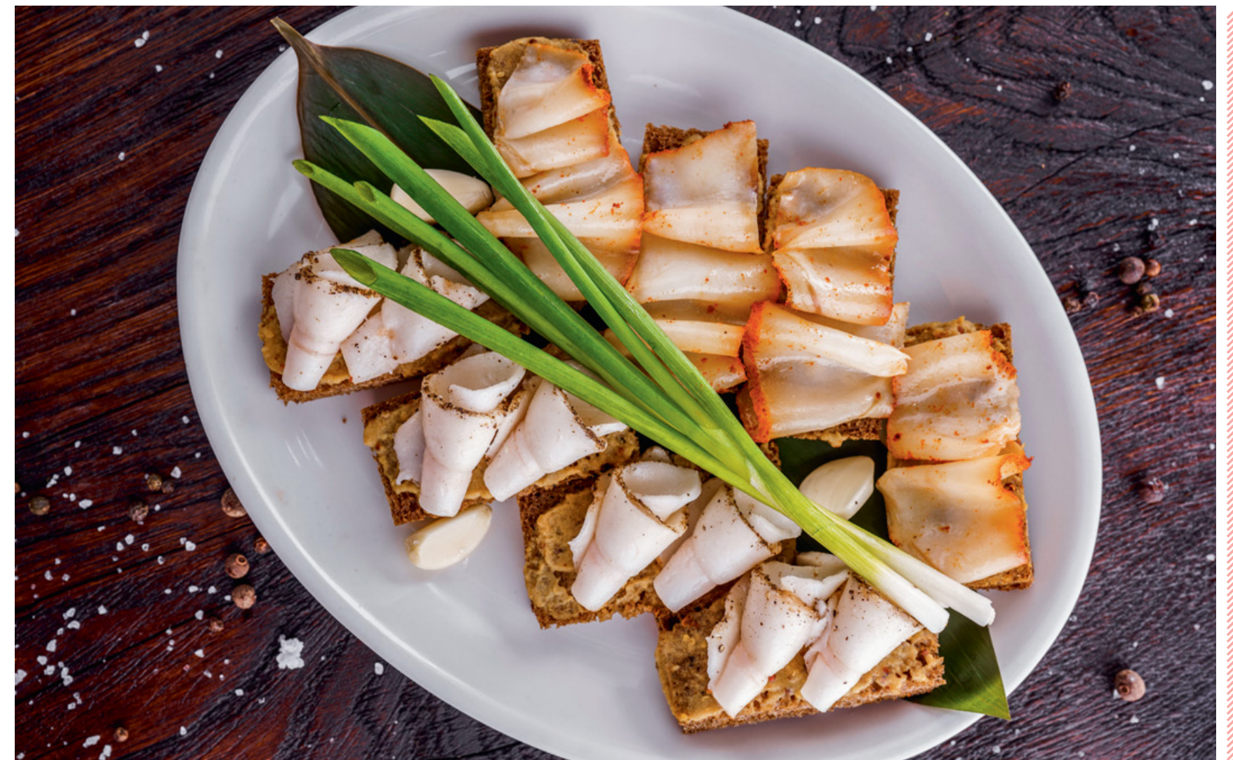
ГРЕНКИ С САЛОМ И ГОРЧИЦЕЙ 120 180