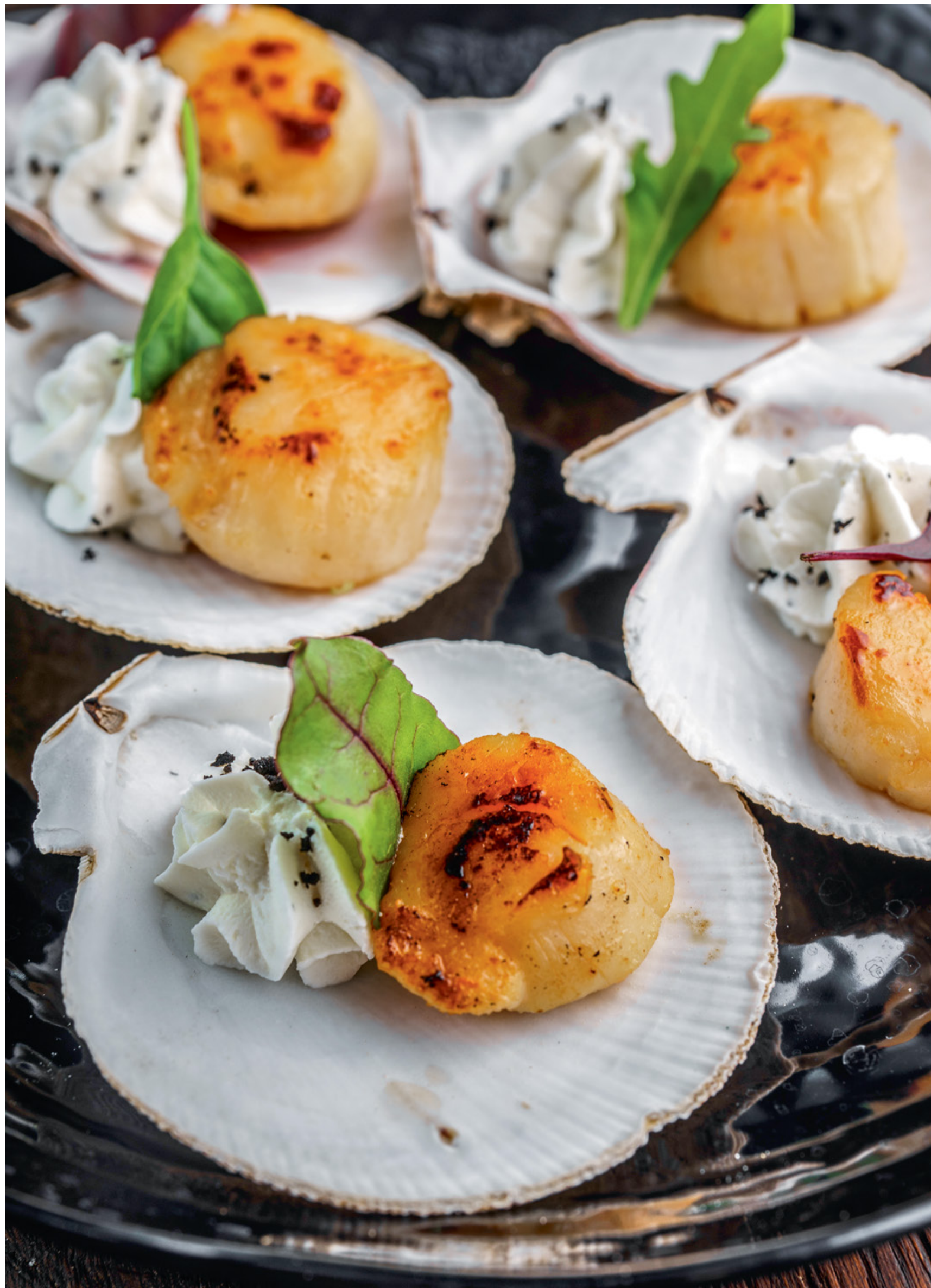
ГРЕБЕШОК С МУССОМ