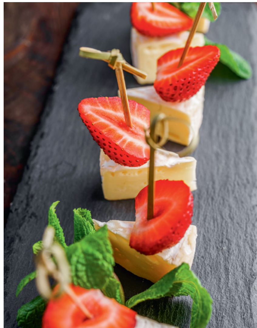
КАНАПЕ КАМАМБЕР С КЛУБНИКОЙ