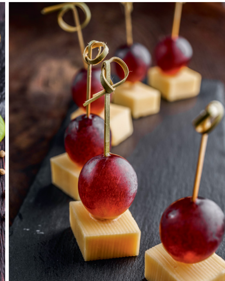
КАНАПЕ ГАУДА С ВИНОГРАДОМ