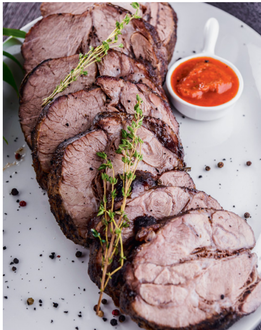
СВИНИНА ЗАПЕЧЕННАЯ С ПРОВАНСКИМИ ТРАВАМИ