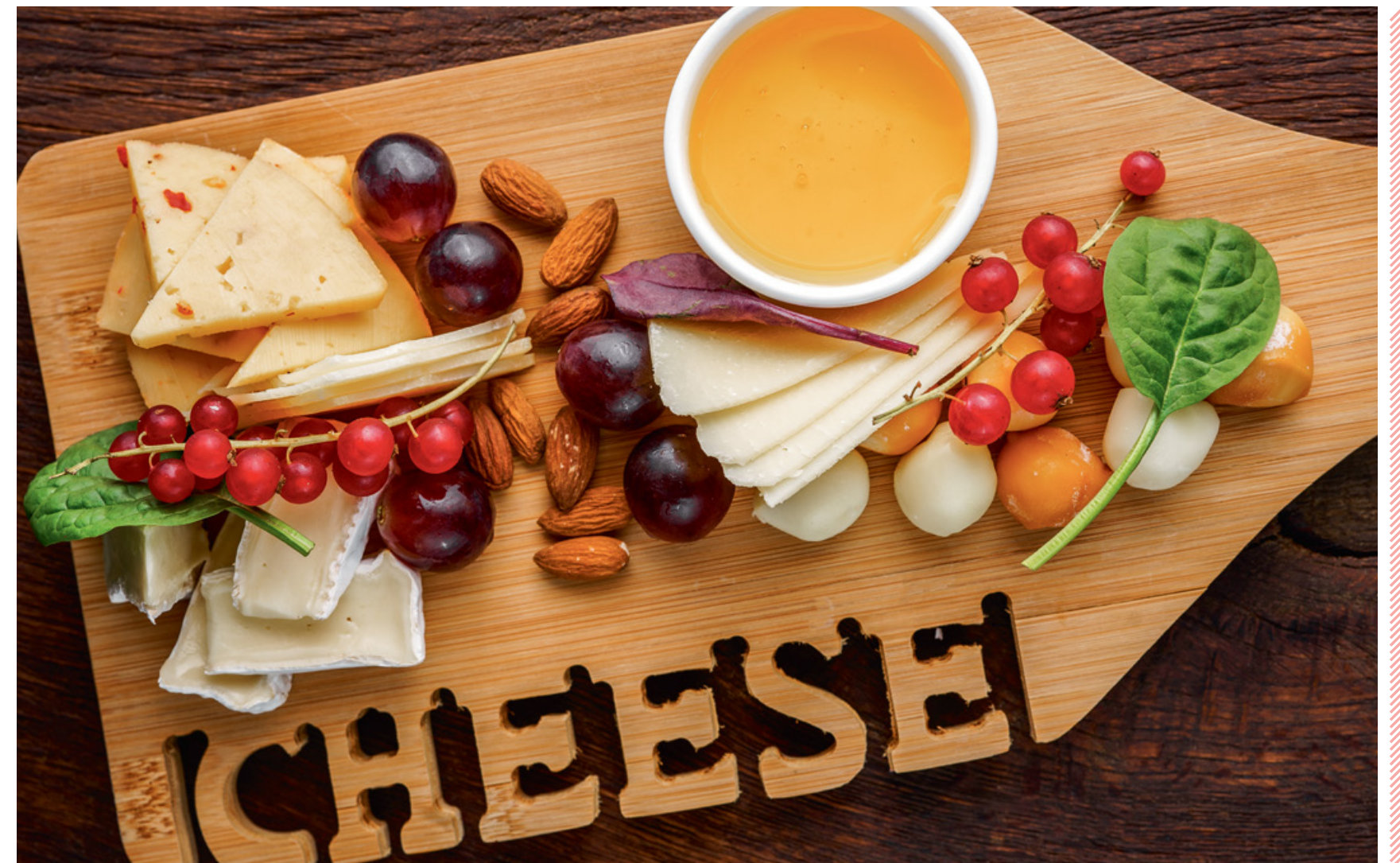
СЕТ ЭЛИТНЫХ СЫРОВ