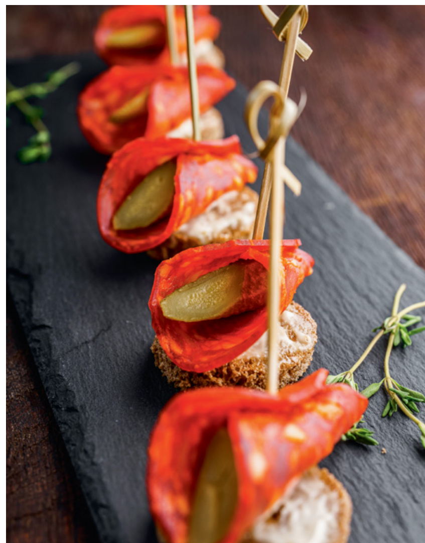
КАНАПЕ С ЧОРИЗО 25 65