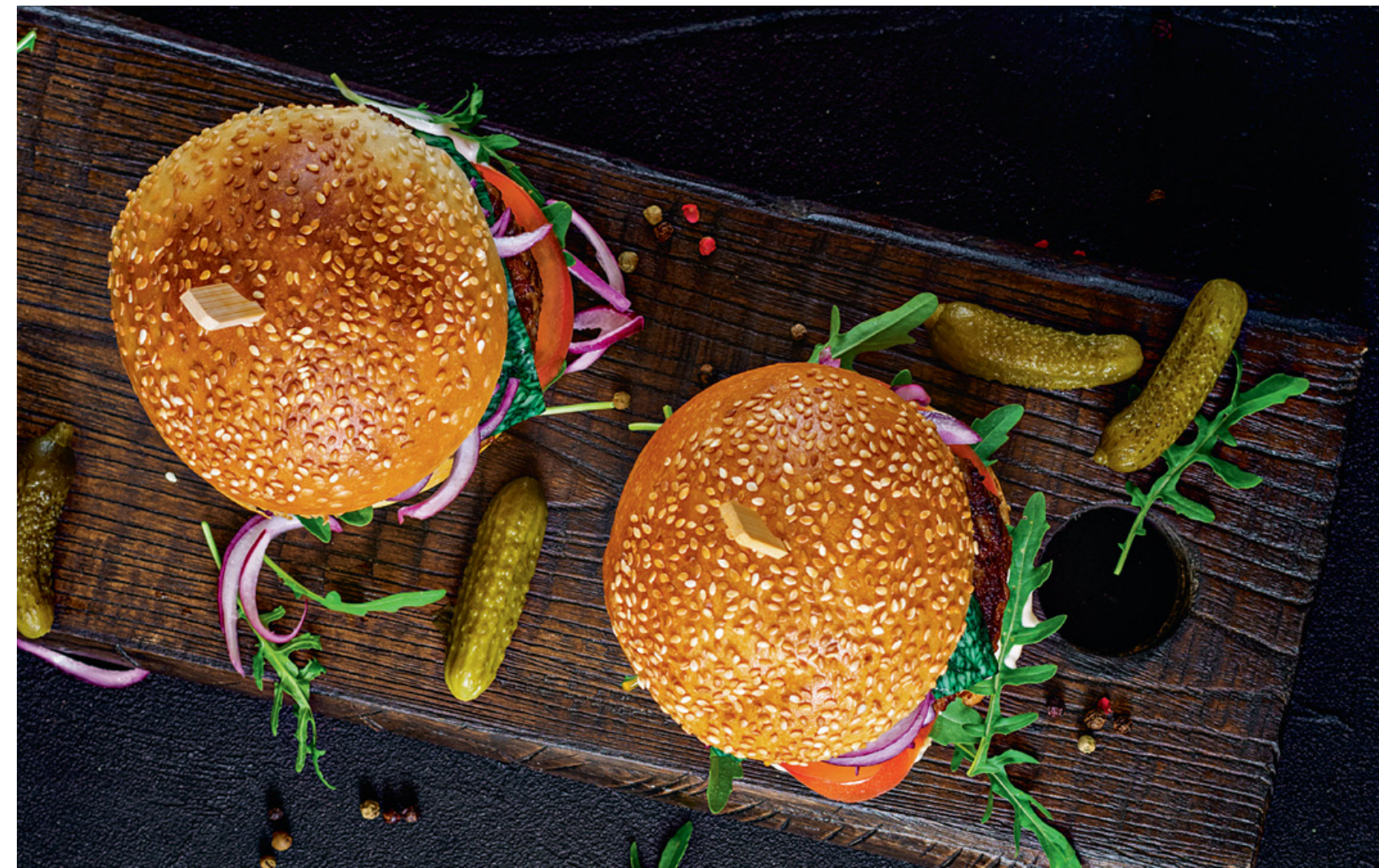
МИНИ-БУРГЕР С КУРИЦЕЙ