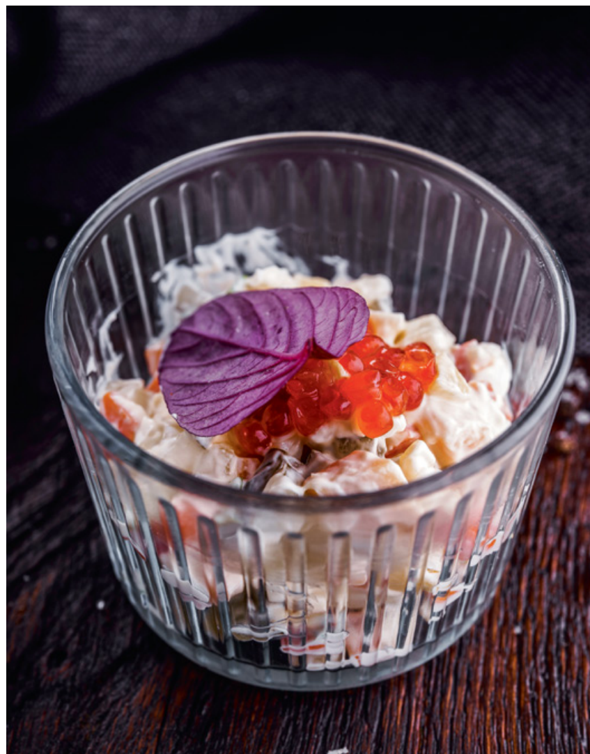
САЛАТ С СЕМГОЙ И ИКРОЙ