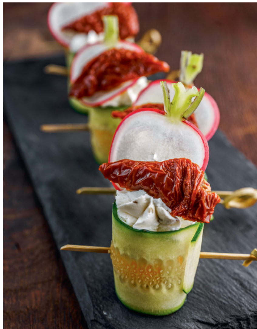
КАНАПЕ ОВОЩНОЕ 40 80