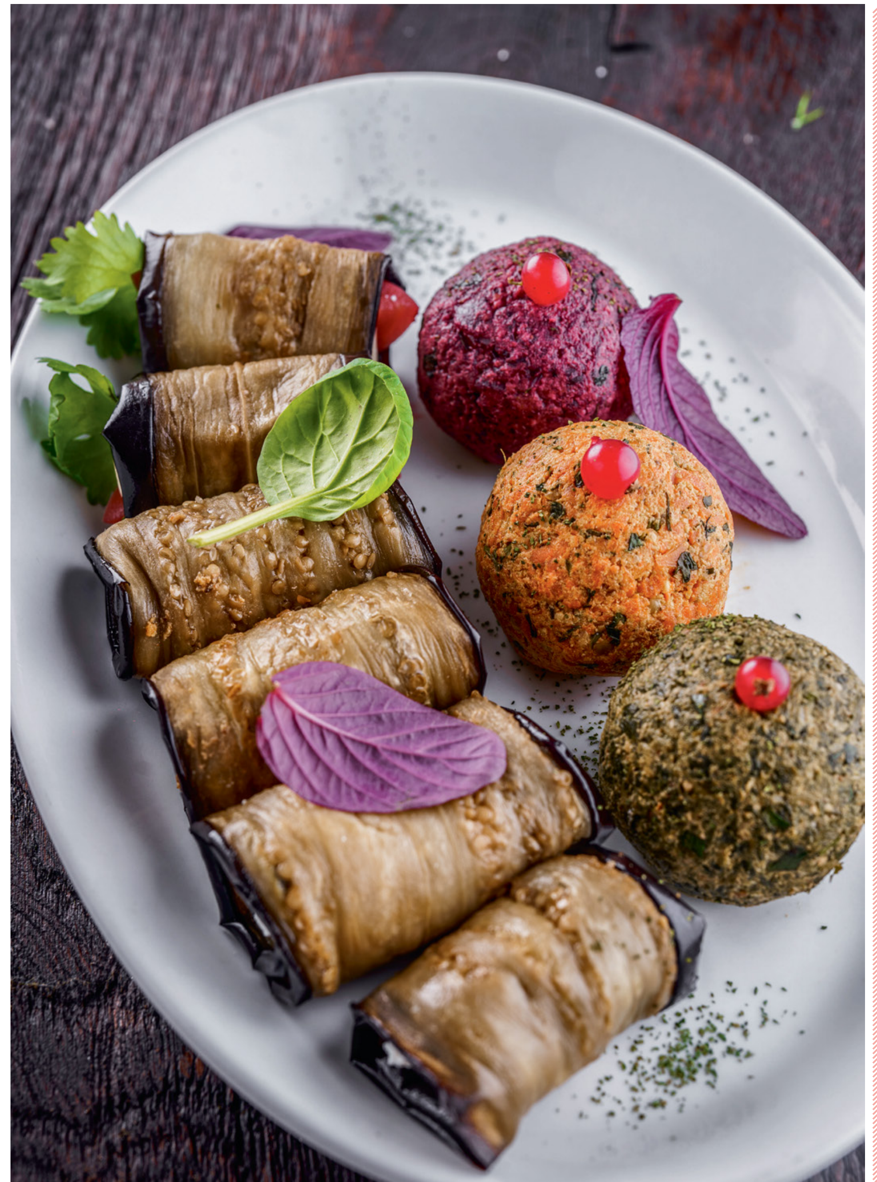
ПХАЛИ 3 шт. 160 320