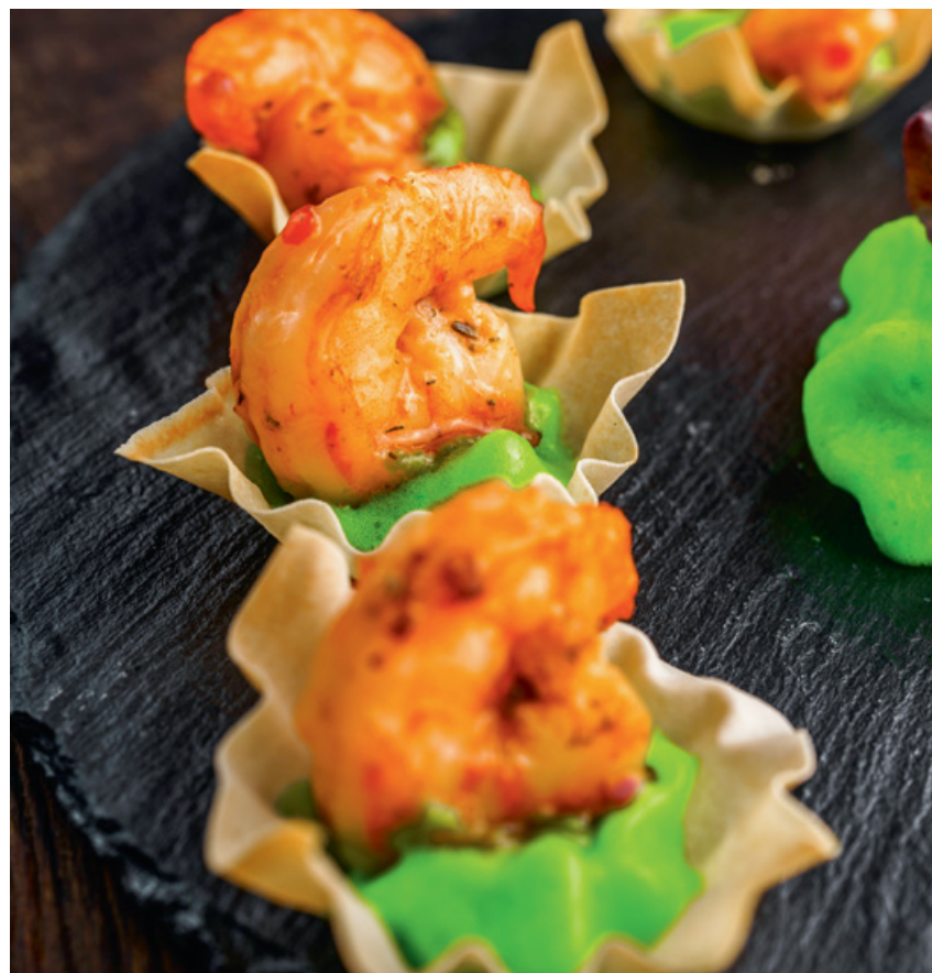
КОРЗИНОЧКА С КРЕВЕТКОЙ И ГУАКАМОЛЕ 25 90