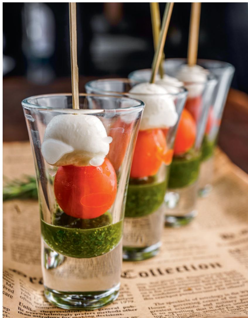
КАНАПЕ ИЗ ЧЕРРИ И МОЦАРЕЛЛЫ