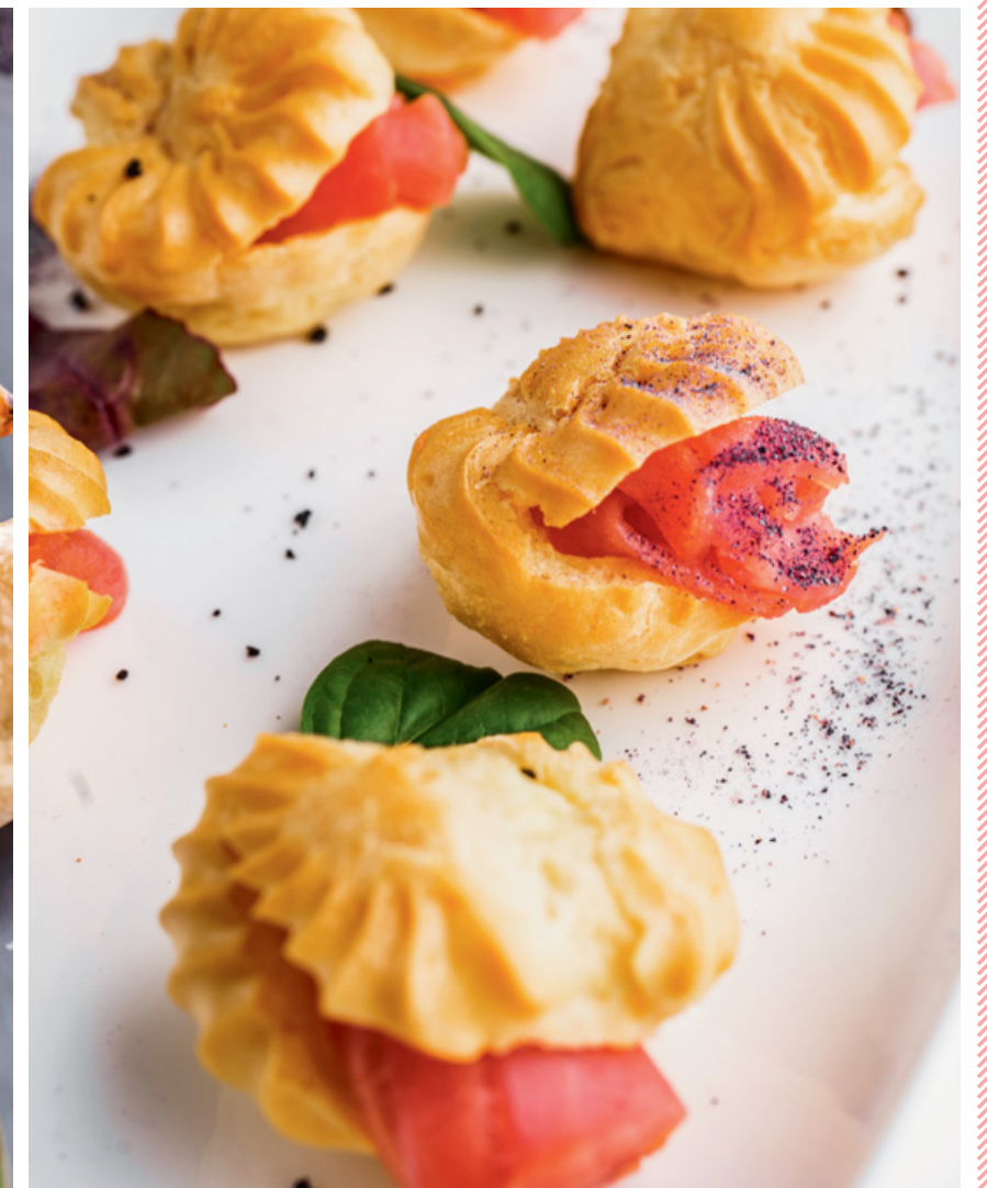
ПРОФИТРОЛИ С ТУНЦОМ 25 85